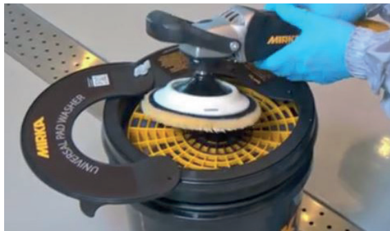
Faire pivoter le couvercle pour l'ouvrir, placer l'outil, faire pivoter le couvercle pour le fermer.