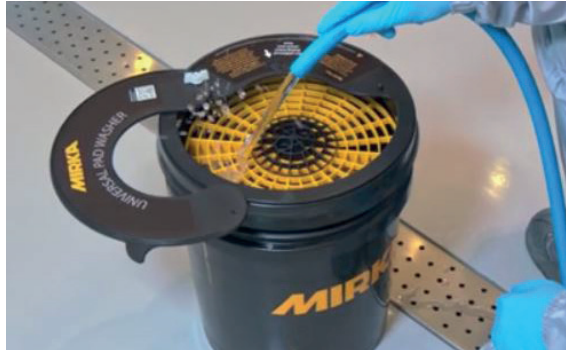
Remplir le seau avec de l'eau.

Convient pour le nettoyage de tous types de peaux et mousses.