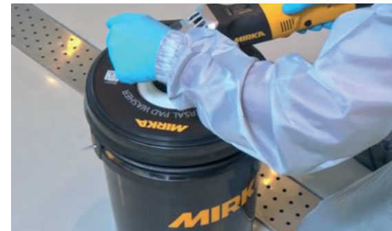
Soulever la machine, la faire tourner à 1500 - 2000 tr/min pour sécher la peau de mouton.