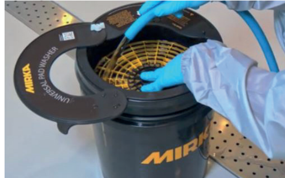
Appuyer sur la grille et remplir d'eau jusqu'au dessus de la grille.