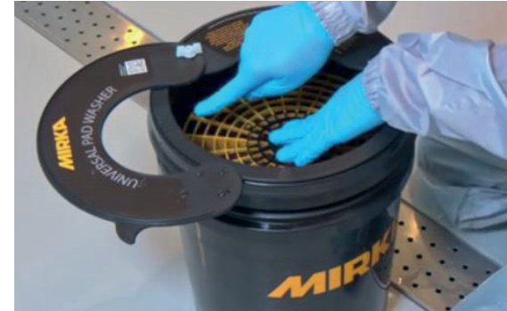
Vérifier le niveau de l'eau.