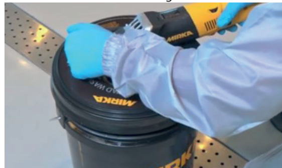
Presser la machine contre la grille, la mettre en marche à environ 800 - 1200 tr/min.