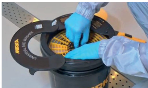
Pour un meilleur séchage, prendre la grille noire centrale.