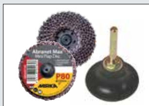
Abranet Max Flap disc y adaptador 50 mm / Abrasivos 40-120