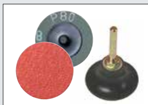
Otros discos de bloqueo rápido (Quick Lock) 50 mm / Abrasivos 36-120