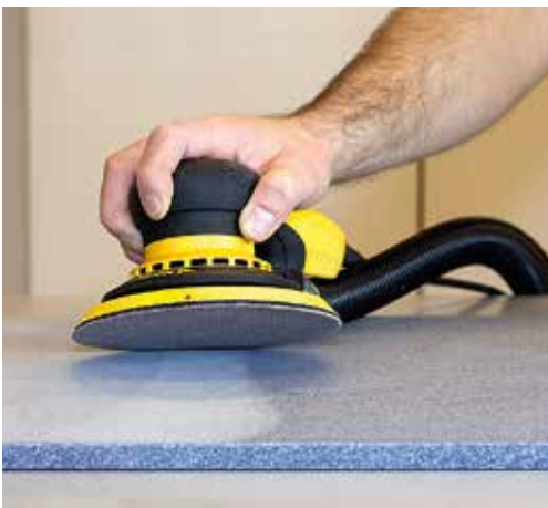
Lijado superior y rápido en diversos tipos de superficies sólidas.