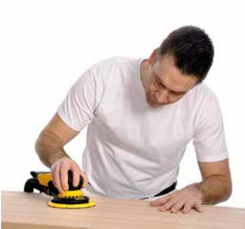
Lijado excelente en maderas duras como las del haya y el roble.

Abranet® Ace – ¡una experiencia de lijado completamente libre de polvo!