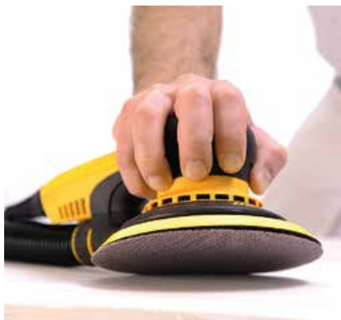
Rendimiento y ciclo de vida óptimos en aplicaciones de lijado de aparejo / fondo.