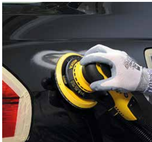
Decapado eficiente de capas duras de pintura / barniz.