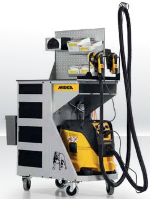
Suggestion de présentation. La servante d'atelier Smart Cart est vendue sans équipement.

Pour plus d'informations, rendez-vous sur www.mirka.fr et consultez nos vidéos sur notre chaîne YouTube.