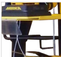
Haken für die Anbringung des Mirka LEROS