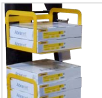
Ablagefächer für Abranet Scheiben 225 mm. (pro Fach 4 Pack möglich)