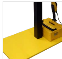
Platz für die Präsentation von Sauger inkl. Mirka Case