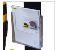
Prospekthalter für Informationsmaterial