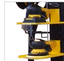
Maschinenhalter inkl. Diebstahlsicherung zur Präsentation von vier Maschinen