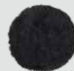
Cuffia lana agnello nera Pro